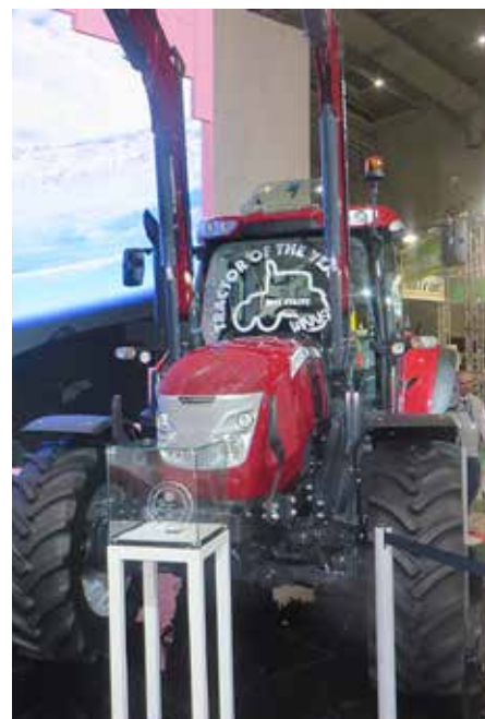
Najboljši vsestranski traktor 2018 (Best utility 2018) je McCormick X6.440 VT-Drive z brezstopenjskim (CVT) menjalnikom iz lastne proizvodnje, ki se krmili enostavno in intuitivno. Traktor moderne in agresivne oblike je primeren za širok spekter uporabe, vključno z uporabo sprednjega nakladalnika.

Marjan Dolensek, KGZS – Zavod LJ (član žirije za Slovenijo)