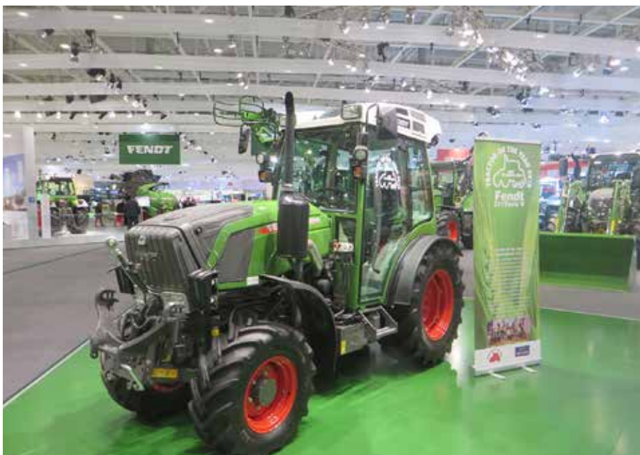
Najboljši specializiran traktor za leto 2018 (Best specialized 2018) je Fendt 211 Vario V. To je kompakten vinogradniški traktor s trivaljnim motorjem in najboljšo usklajenostjo med le-tem in brezstopenjskim (CVT) menjalnikom med tovrstnimi traktorji ter vrhunsko opremo.

boljši vsestranski traktor so bili to John Deere 5125R, Massey Ferguson 5.709 Dyna 4, McCormick X6 VT-Drive, New Holland T4S.75 in Valtra A114, v kategoriji najboljši specializiran traktor pa Aebi TT281, Claas Nexos 240 VE, Fendt 211 Vario V, Kubota M5101 N in Massey Ferguson 3719 S. Vsi izbrani finalisti so kandidirali za naziv najboljši traktor po obliki. Vse traktorje, ki smo jih praktično preskusili, smo vam predstavili v minulih številkah Kmetovalca.